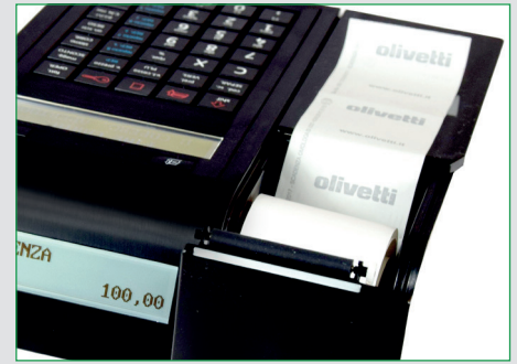
Inserimento rapido e agevole del rotolo carta