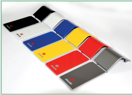
Design moderno e look personalizzabile