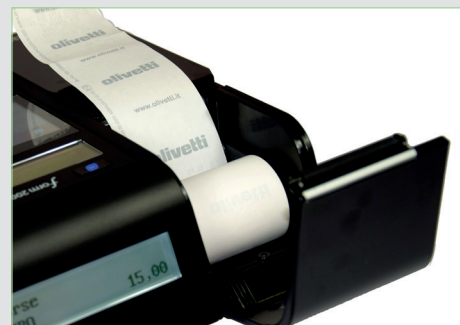
Inserimento rapido e agevole del rotolo carta