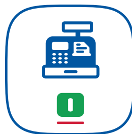
L'icona del launcher