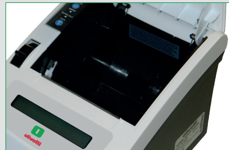
Caricamento rotolo easy loading